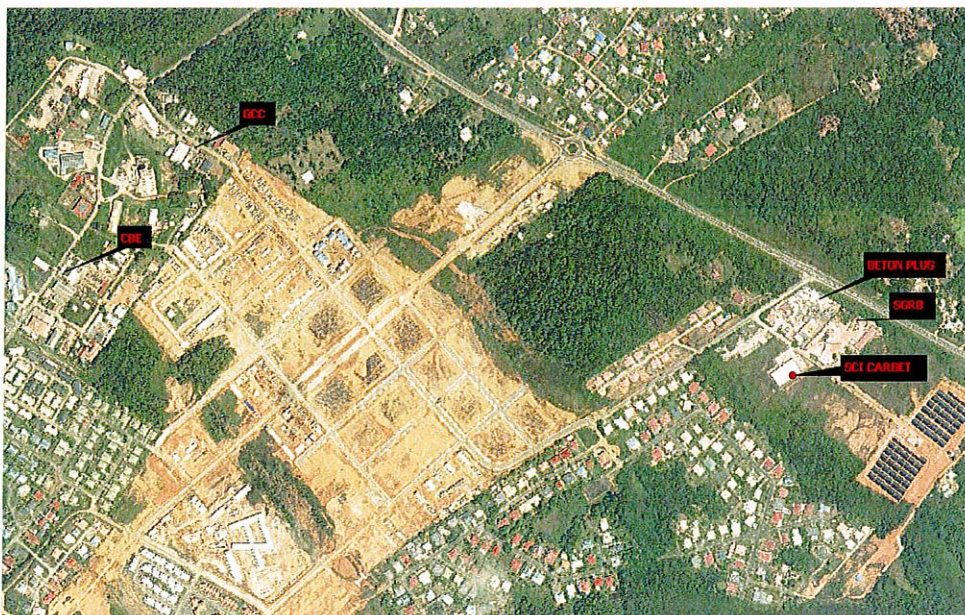
Localisation des ICPE de la zone